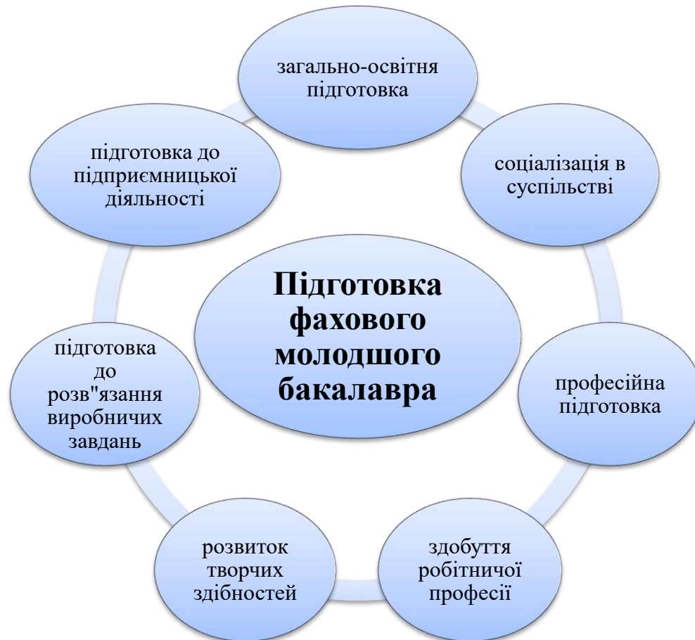
Рис. 3. Технологічна карта формування моделі студента Новороздільського політехнічного фахового коледжу.

У найближчій перспективі необхідно передбачити: