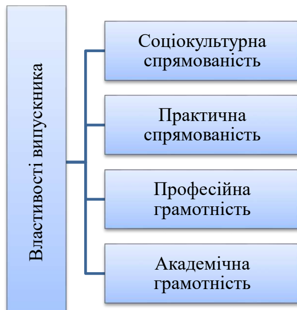
Рис. 2. Модель випускника Новороздільського політехнічного фахового коледжу.

При цьому необхідно враховувати такі чинники: