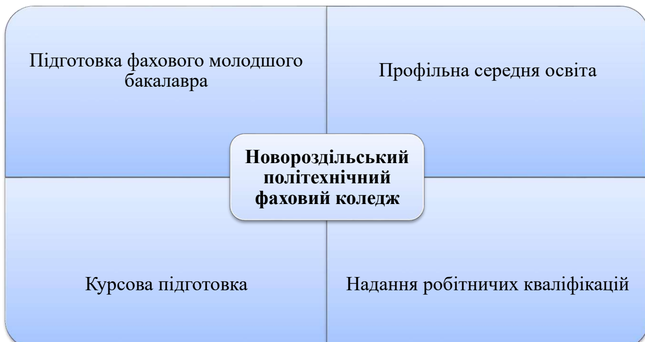
Рис. 1. Модель освітнього процесу Новороздільського політехнічного фахового коледжу

- забезпечення умов всебічного розвитку розумових, фізичних і наукових здібностей студентів, які навчаються в коледжі, необхідних для здобуття ними фахової передвищої освіти, формування у них високих моральних якостей, патріотизму, суспільної свідомості; збереження та відновлення матеріально-технічної бази та підвищення ефективності фінансово-економічної діяльності.